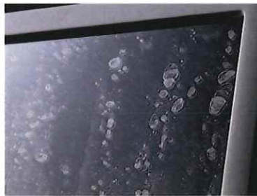
鏡に付着した水垢のイメージ